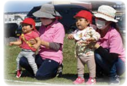
何をするのかなあ!?