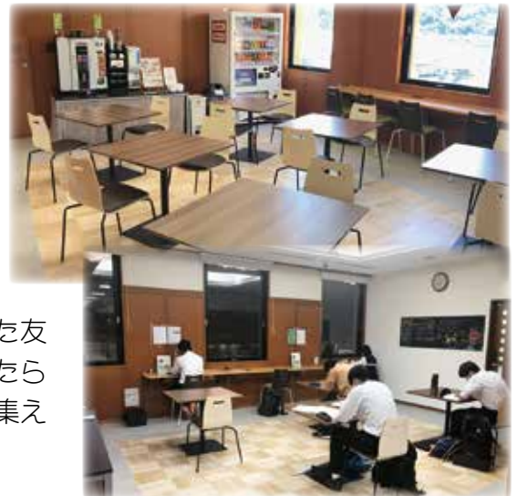
〈誰でも自由に利用できるカフェスペース〉

地域の皆さまが、この施設に通うことで日常生活にリズムが生まれ、体調がよくなり、活力が湧き、気心の知れた友人などとの交流が生まれ、自身の体や生活により変化がもたらされることを、そして今後、地域の見守りを兼ねた誰もが集える場になっていくことも期待しています。